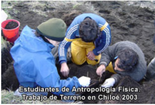
Estudiantes de Antropología Física. Trabajo de Terreno en Chiloé 2003

La Facultad tiene como objetivo principal el estudio crítico de la realidad social y cultural del país, a través de las disciplinas que imparte. Esta realidad pertenece tanto al pasado como al presente, y comprende a las sociedades y culturas urbanas y campesinas, incluyendo a los diversos grupos étnicos.